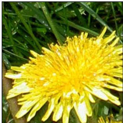
Maskros från gården

Kolen brukar vara grillbar runt kl. 18. För den som vill slippa tänka på tillbehör till det grillade, går det att köpa från buffén till självkostnadspris, vilket brukar vara runt 40 kr.