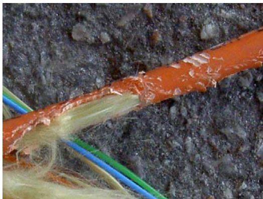
Den trasiga kabeln med gnagmärken